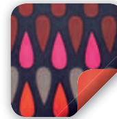
Rain Drop Außen Fireball Innen