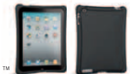
14284 Black 39,90 €* TM