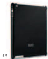
14282 Black 24,90 €* TM