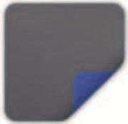
Charcoal Außen Concorde Blue Innen