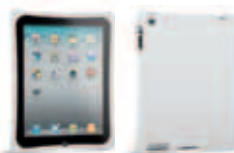
14286 White 39,90 €* TM