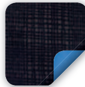
Graphite Grid Außen Cornflower Blue Innen