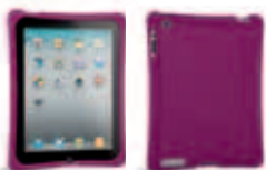
14285 Raspberry 39,90 €* TM