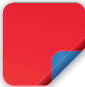
Fireball Außen Cornflower Blue Innen